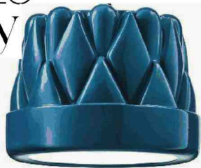
Colorata Sospensione Babette, by Cristina Celestino, in ceramica smaltata. Torremato , a Euroluca, ( torremato.com ).

Il Salone stupisce non solo per le strade di Milano: sul web inaugura DesignaMilano , il portale ideato dall'architetto Ettore Lariani (cui, una sua opera "seriale") che permette di acquistare pezzi di design unici a un prezzo accessibile, grazie all'idea di mettere in comunicazione diretta gli acquirenti con gli artigiani, saltando così i costi di intermediazione e di distribuzione ( designamilano.it ).