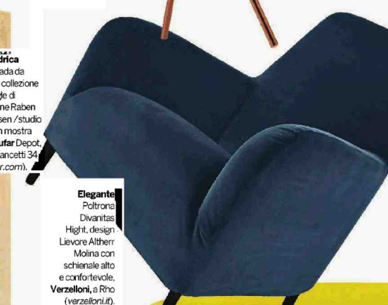
Elegante Poltrona Divanitas Hight, design Lievore Altherr Molina con schienale alto e confortevole. Verzelloni , a Rho ( verzelloni.it ).