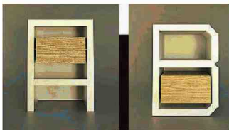
Lettere mobili Alfabeto, serie di comodi contenitori composti da un cassetto sostenuto da una struttura a forma di lettera. DesignaMilano.

Lo spazio ridotto può incentivare la creatività. Affidati a un professionista possono diventare un capolavoro. Le Corbusier arredò il suo minuscolo studio Le Cabanon in Costa Azzurra con i pochi mobili necessari alla sua vita quotidiana ( designhostel.it ).